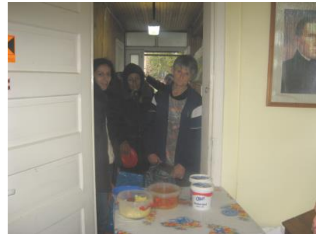
Sozialküche, Temeswar – Einrichtung - engagierte Köchinnen - Essensausgabe